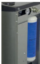
Réglage du mélange de CO 2 /eau pour une eau pétillante à très gazeuse