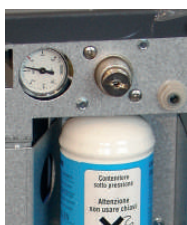
Manomètre intégré pour contrôler la pression du CO 2 .